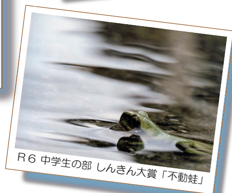
R6 中学生の部 しんきん大賞「不動蛙」