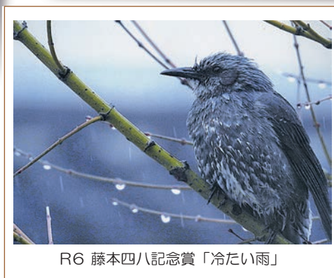
R6 藤本四八記念賞「冷たい雨」