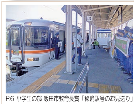
R6 小学生の部 飯田市教育長賞「秘境駅号のお見送り」