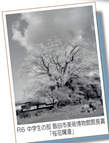
R6 中学生の部 飯田市美術博物館館長賞「桜花爛漫」