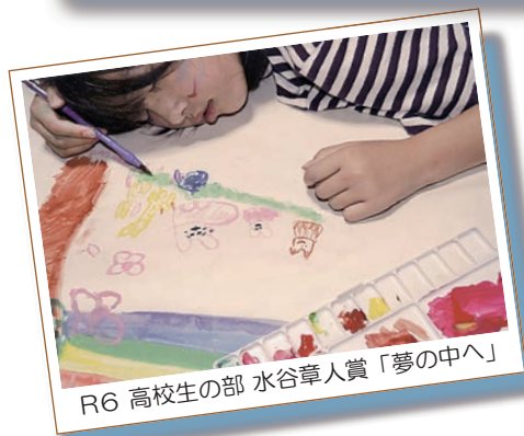
R6 高校生の部 水谷草人賞「夢の中へ」