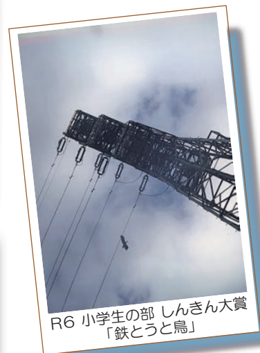
R6 小学生の部 しんきん大賞「鉄とうと鳥」