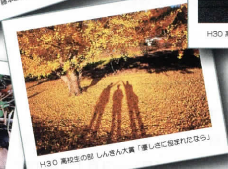
H30 高校生の部 しんきん大賞「優しさに包まれたなら」