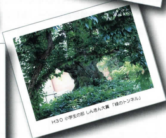
H30 小学生の部 しんきん大賞「緑のトンネル」

飯田が生んだ写真家藤本四八にちなんで、小・中・高校生を対象にした写真賞を行います。伊那谷の自然や文化、そこに暮らす人びと……皆さんの眼（カメラ）でとらえた作品を、ぜひ応募してください。