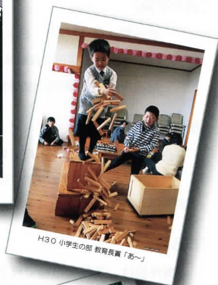
H30 小学生の部 教育長賞「あ〜」