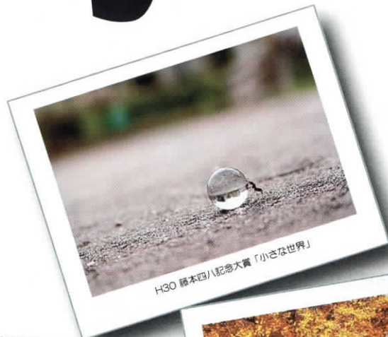
H30 藤本四八記念大賞「小さな世界」