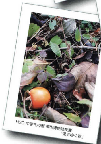
H30 中学生の部 美術博物館長賞「過ぎゆく秋」