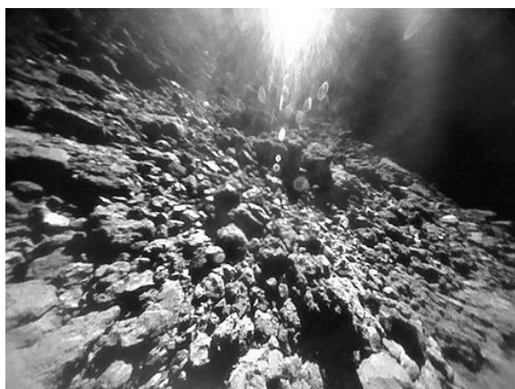
2018年9月23日小型ローバMINERVA-II 1-ROVER-1Bのホップ直前の画像