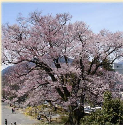
飯田さくらものがたり —桜の名木と城下町の歴史の物語です