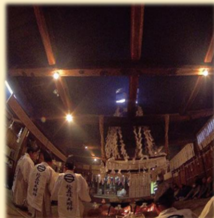
遠山霜月祭 —神々に太陽と命の再生を祈ります