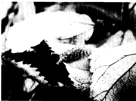
図 1 ゴマダラチョウ越冬幼虫

2002 年には成虫を目撃している。高さ 3 m 程の自生のエノキの根本で、越冬中の幼虫を確認した。