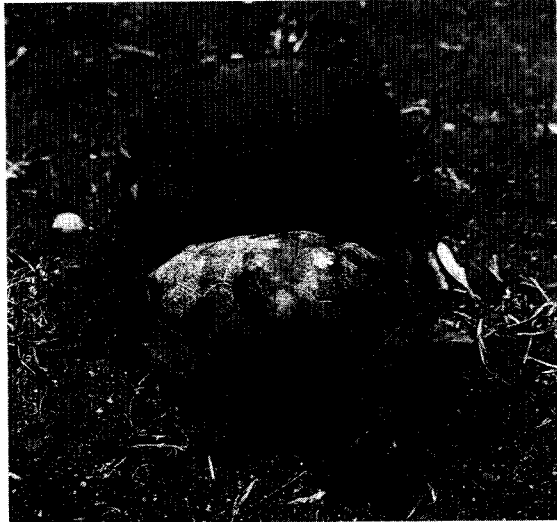
図2 飯田市立石で確認したニホンイシガメ