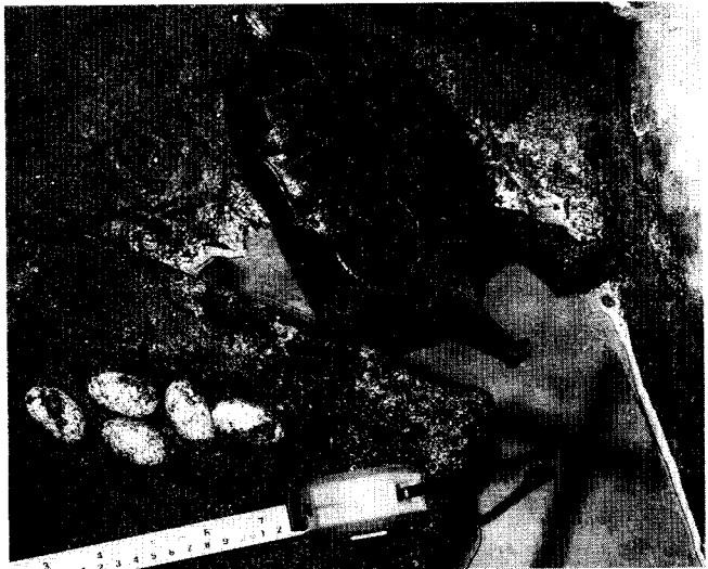
図3 高森町で確認したニホンイシガメとその卵