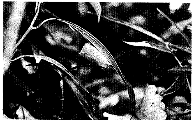
図3 食樹の葉裏で発見した越冬蛹 1997.3.9, 天龍村平岡