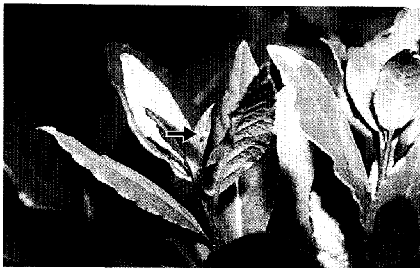
図2 ゲッケイジュに産卵された卵 (→) 1975.5, 天龍村平岡