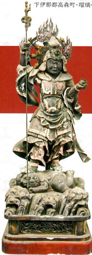
毘沙門天立像(個人蔵)