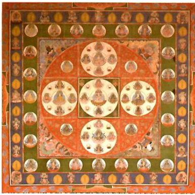
両界曼荼羅図(金剛界) 下伊那郡高森町・瑠璃寺蔵