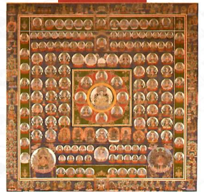
両界曼荼羅図(胎藏界) 下伊那郡高森町・瑠璃寺蔵