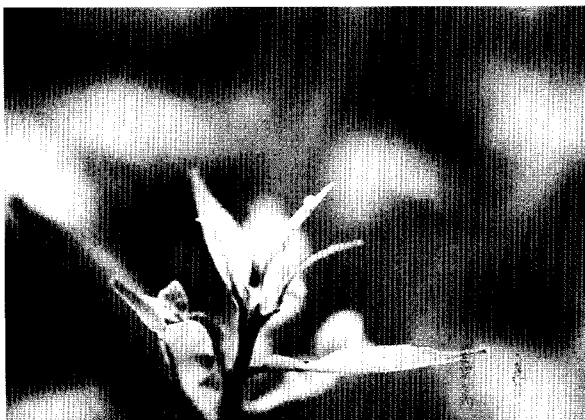
図1 ユズの若芽に産卵された卵