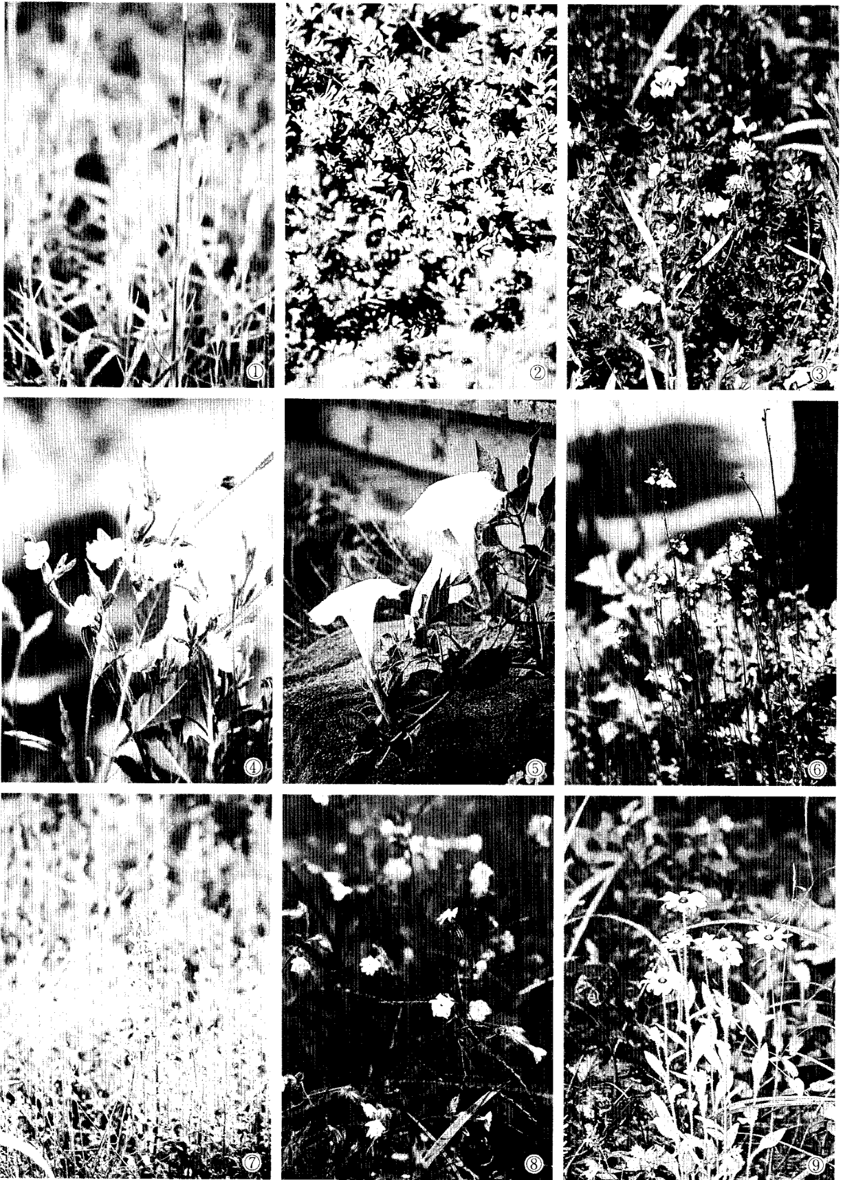
図2 近年侵入した帰化植物 ①イヌコモチナデシコ ②アレチニシキソウ ③セイヨウミヤコグサ ④ユウゲショウ ⑤ケチョウセンアサガオ ⑥マツバウンラン ⑦キキョウソウ ⑧マツヨイセンノウ ⑨アラゲハンゴンソウ